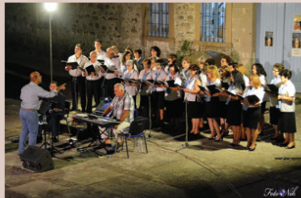
Η χορωδία στο Πολύκεντρο στις 17-8--2016