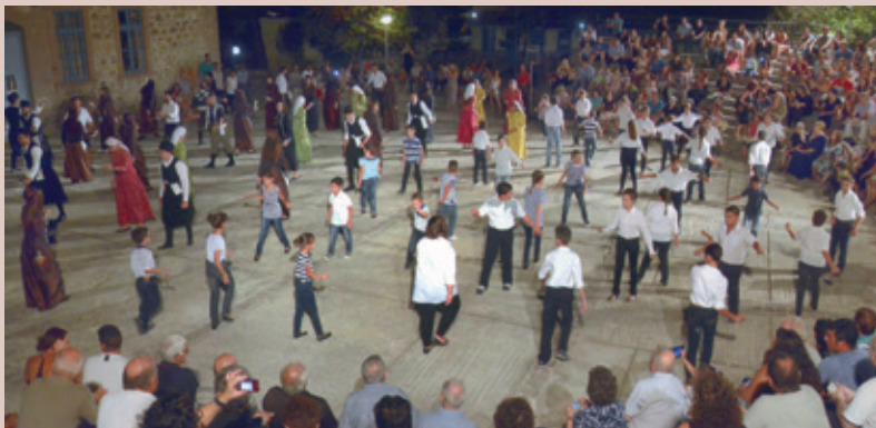
ΠΕΜΠΤΗ 11 ΑΥΓΟΥΣΤΟΥ 2016: Χορευτική βραδιά,