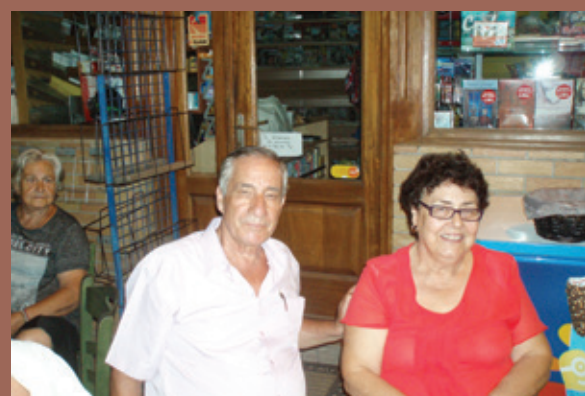
Γλέντι του Συλλόγου μας στην πλατεία του χωριού στις 19-8-2016