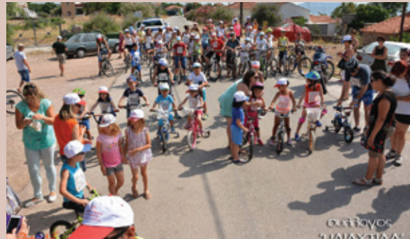
Κυριακή, 26-6-2016, 1ος ποδηλατικός γύρος παραλίας Μανταμάδου.