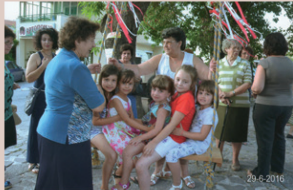
ΔΕΥΤΕΡΑ 29 ΙΟΥΝΗ 2016: Στον πλάτανο στα «Γουρνέλια» : «Κούνια»