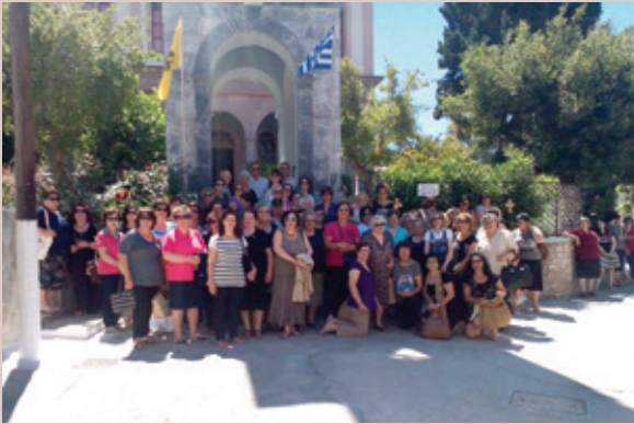
Από την εκδρομή του συλλόγου "ΟΜΟΝΟΙΑ" στον Αγ. Αντώνιο στο Τρίγωνα Πλωμαρίου