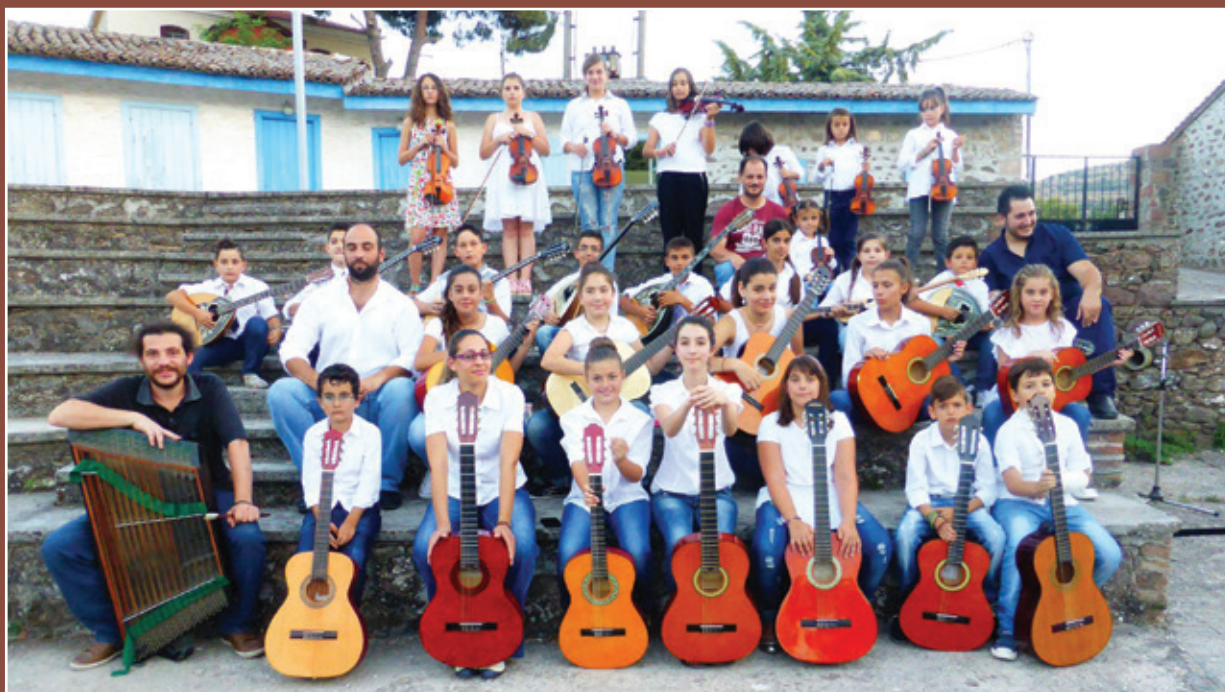
Παιδική Ορχήστρα του Συλλόγου Γονέων και Κηδεμόνων Δημοτικού Σχολείου και Νηπιαγωγείου Μανταμάδου