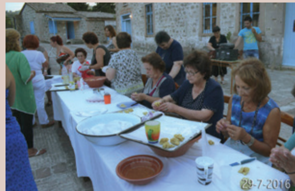
ΠΑΡΑΣΚΕΥΗ 29 ΙΟΥΛΗ: Στη Μηχανή τ' Αγίου (Πολύκεντρο) «αμυγαλωτά» με Μανταμαδιώτικη συνταγή