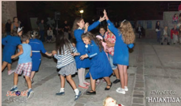
Σάββατο, 13-8-2016, Πολύκεντρο Μανταμάδου: «παιχνίδια, όπως τα παλιά».