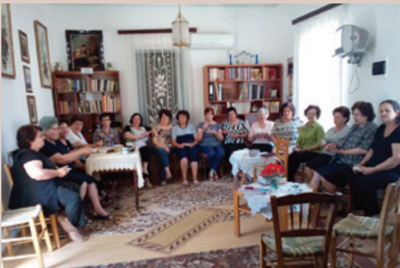
Ο τελευταίος καφές πριν το καλοκαίρι στο σπίτι του συλλόγου "ΟΜΟΝΟΙΑ"