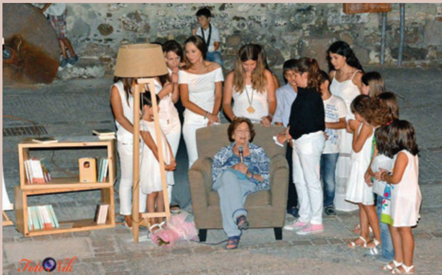
Τρίτη, 26 Ιούλη στο Πολύκεντρο Μανταμάδου: «Μια βραδιά με την Άλκη Ζέη» σε συνεργασία με το βιβλιοπωλείο Μαδαμαδι.