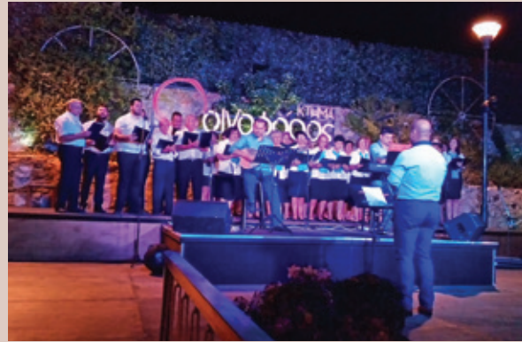
Η χορωδία στο κτήμα "ΟΙΝΟΦΟΡΟΣ" στη Μυτιλήνη